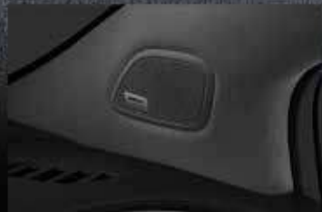
Sistema de audio premium Bose®.