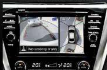
Around View Monitor.