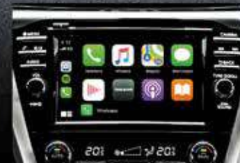
Carplay / Android Auto.