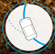
CONTROL DINÁMICO VEHICULAR (VDC)